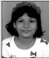
ഈയ ബിനു സെന്റ് ജോർജ്ജ് അറത്തിൽ ലളിതഗാനം ഭദ്രാസനം - 2nd